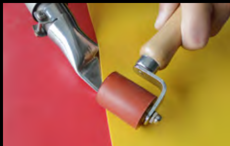
Soldagem de sobreposição