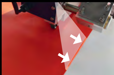
Guia laser para maior precisão