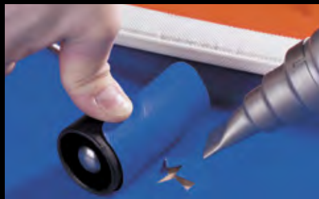
Remendos de solda ou outros trabalhos de reparo