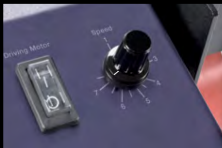
Escolha a velocidade desejada.