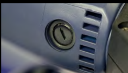
Escova de carbono fácil e rapidamente trocável