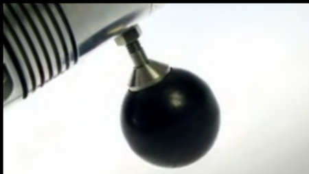
Puxador montável de ambos os lados ajuda a manter a sua ferramenta mais limpa