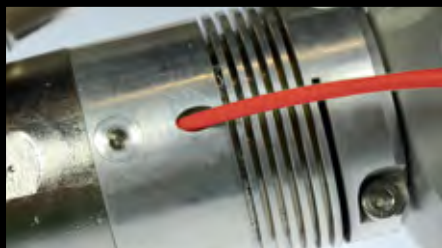
Fios de solda fáceis de inserir dos dois lados para posições de soldagem flexíveis