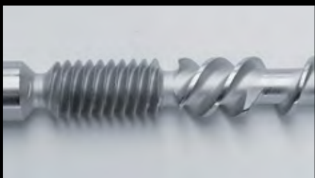
Parafuso de alta qualidade para maior durabilidade