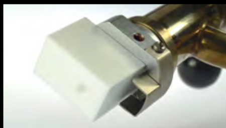
Sapatas de soldagem rapidamente substituíveis contribuem para uma maior produtividade