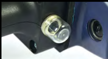
Proteção contra sobrecarga visível para maior controle