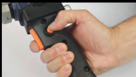
Botão de bloqueio para soldagem de extrusão contínua com menor esforço