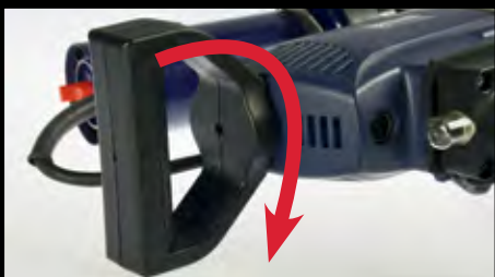
Punho ajustável para alta ergonomia