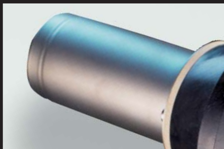
Proteção do tubo de aquecimento para maior segurança