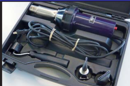
Caixa rígida para facilitar a armazenagem (incluída no fornecimento)