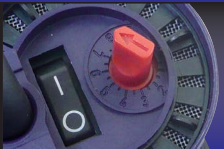
Temperatura regulável livremente